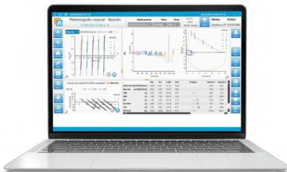
Plethysmografía PowerCube Body+

La plataforma LFX presenta todos los resultados de las pruebas en un informe único, lo que facilita la comparación de los datos y proporciona a los médicos una visión más completa para tomar decisiones de tratamiento más informadas para el paciente.