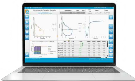
Espirometría forzada SpiroScout